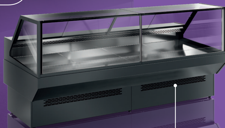
MAXI ADVANCE SQ